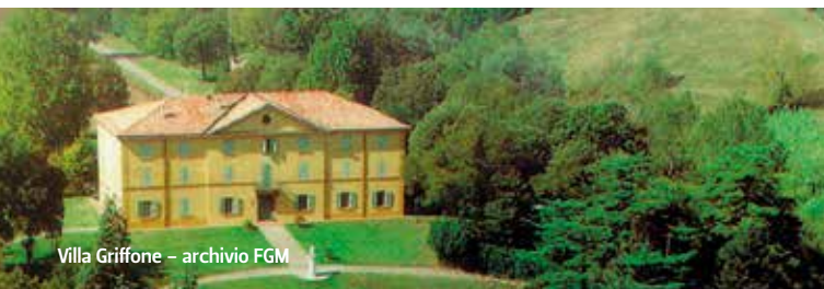
Villa Griffone

Residenza principale della famiglia Marconi, da metà Ottocento. Qui Guglielmo Marconi allestì il suo laboratorio e realizzò i suoi primi esperimenti di radiotelegrafia (1895). Il sottostante Mausoleo di Guglielmo Marconi è opera dell'architetto Marcello Piacentini. L'intero complesso è monumento nazionale. Alla morte dello scienziato nel 1937, la Villa divenne sede della Fondazione Marconi , costituita nel 1938. Parti integranti del patrimonio della fondazione sono la Biblioteca e l' Archivio con numerosi fondi marconiani. La Villa è sede del Museo Marconi , dedicato alle origini e agli sviluppi delle radiocomunicazioni. Grazie all'integrazione di apparati storici, filmati e dispositivi interattivi, il visitatore ha la possibilità di ripercorrere le vicende che hanno caratterizzato la formazione, la vita e l'attività di imprenditore di Guglielmo Marconi nella Compagnia che egli fondò nel 1897. Nel parco si trovano cimeli marconiani e sculture che raffigurano il grande inventore. www.fgm.it