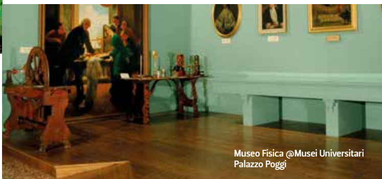
Museo Fisica @Musei Universitari Palazzo Poggi

Nell'antica sede dell'ateneo bolognese, che attualmente ospita la Biblioteca Comunale, nel 1926 Guglielmo Marconi tenne una conferenza in occasione della cerimonia per il trentesimo anniversario della telegrafia senza fili. www.archiginnasio.it