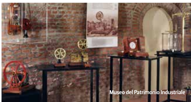
Museo del Patrimonio Industriale

Le origini dello stadio comunale Renato Dall'Ara risalgono al 1927, quando fu inaugurato col nome di Littoriale da Benito Mussolini. In occasione del conferimento della laurea ad honorem in fisica da parte dell'Università di Bologna il 5 maggio 1934, Guglielmo Marconi si recò poi al Littoriale per inaugurare la fiera di Bologna insieme al Podestà Manaresi.