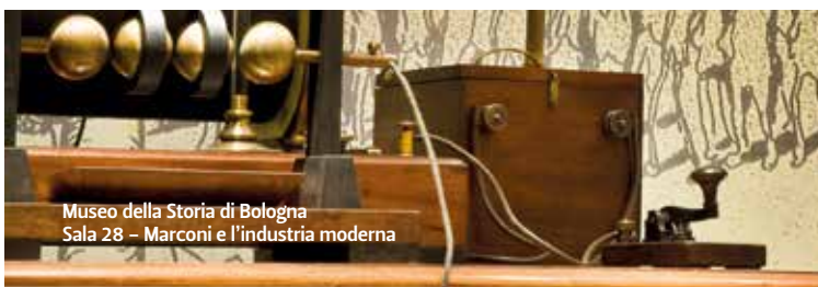
Museo della Storia di Bologna Sala 28 – Marconi e l'industria moderna