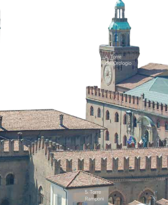
4. Torre dell'Orologio