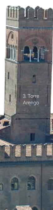
3. Torre Arengo