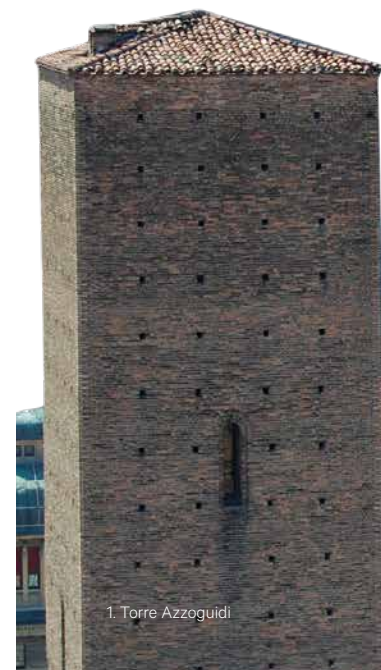
1. Torre Azzoguidi