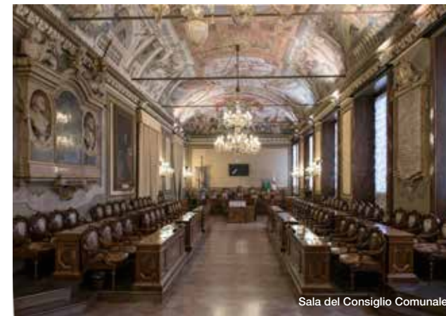
Sala del Consiglio Comunale