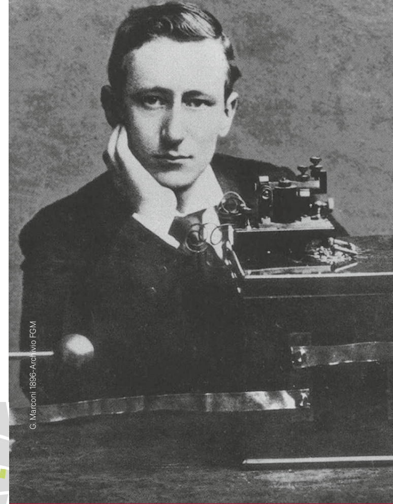
G. Marconi 1896