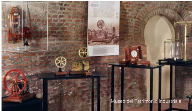
Museo del Patrimonio Industriale

Le origini dello stadio comunale Renato Dall'Ara risalgono al 1927, quando fu inaugurato col nome di Littoriale da Benito Mussolini. In occasione del conferimento della laurea ad honorem in fisica da parte dell'Università di Bologna il 5 maggio 1934, Guglielmo Marconi si recò poi al Littoriale per inaugurare la fiera di Bologna insieme al Podestà Manaresi.