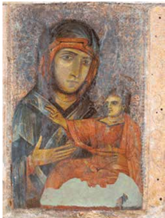
Icono bizantino del los siglos X-XI, restaurado en el siglo XII-XIII, adorado sobre la Colina de la Guardia desde finales del siglo XII

T. +39 051 6142339 - www.santuariobeataverginesanluca.com