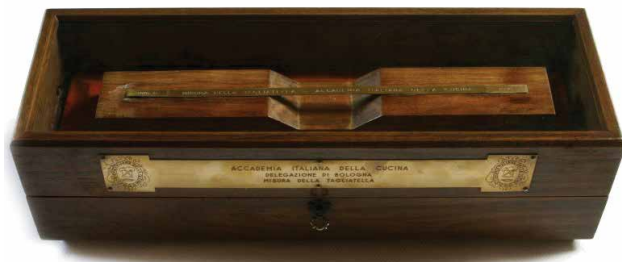
Misura della Tagliatella

Dal 1972 al suo interno è esposto un campione in oro della vera Tagliatella bolognese, la cui larghezza corrisponde alla 12.270esima parte della Torre degli Asinelli: un esempio tipicamente bolognese della procedura internazionalmente seguita per definire le unità di misura standard.