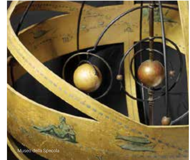
Museo della Specola

Straordinaria cornice della Basilica di Santa Maria dei Servi, il Portico dei Servi è stato teatro di alcune delle più grandi disfide matematiche. Questa tradizione risale al Rinascimento, quando, per risolvere controversie tra studiosi, venivano indetti veri e propri duelli pubblici. Di fronte ad una folla di spettatori, due o più matematici gareggiavano nella risoluzione degli stessi problemi, spesso proposti e risolti in rima, veri e propri "teoremi in poesia". Una delle più importanti disfide del '500, quella che portò alla risoluzione delle equazioni di terzo grado ad opera di Scipione dal Ferro, ebbe luogo proprio sotto il Portico dei Servi.