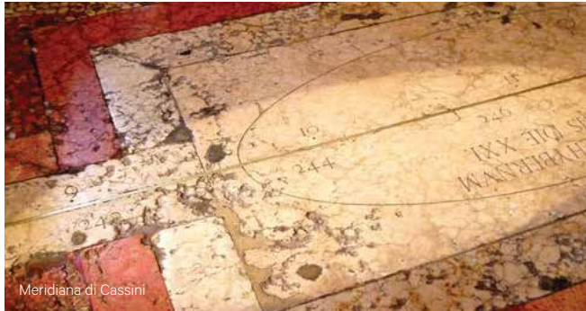
Meridiana di Cassini