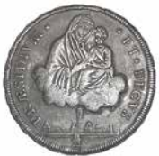
Une monnaie d'argent de dix paoli, imprimée à Bologne en 1796