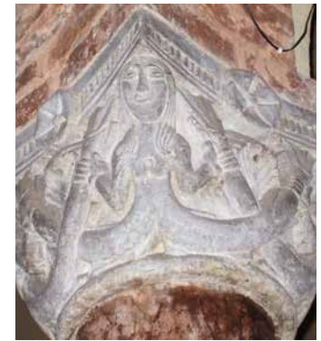
Santo Stefano. Sirena bicaudata

proseguì con duemila anni di storia. Tra realtà e leggenda, si legge l'ombra lunare dei simboli ermetici e alchemici che arricchiscono le sue mura. Fu definita la Santa Gerusalemme Occidentale, infatti, la chiesa del Santo Sepolcro riproduce in scala le esatte misure del Santo Luogo gerosolimitano. La tradizione ermetica racconta che il Santo Graal sia rappresentato nel Catino del cortile di Pilato.