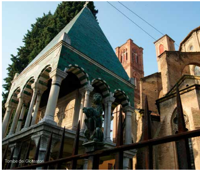
Tombe dei Glossatori A cura di Bologna Magica (www.bolognamagica.com)