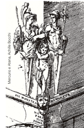
Mercurio e Atena, Achille Bocchi

Ai piedi della torre più piccola, la Garisenda, si aprono gli antichi cancelli di quello che fu il ghetto ebraico bolognese, come ricorda la via dei Giudei. Qui ebbero sede gli studi più misteriosi della città, inerenti all'Alchimia e alla Cabala. Parlando di Alchimia ricordiamo Vincenzo Casciarolo (1571-1624) che nel tentativo di trovare la pietra filosofale, creò invece la pietra fosforica che, ancora oggi, viene ricordata come la pietra di Bologna o pietra luciferina . Ne trattò le magiche virtù anche Goethe.