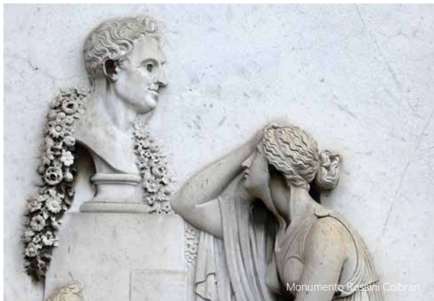
Monumento Rossini Colbran