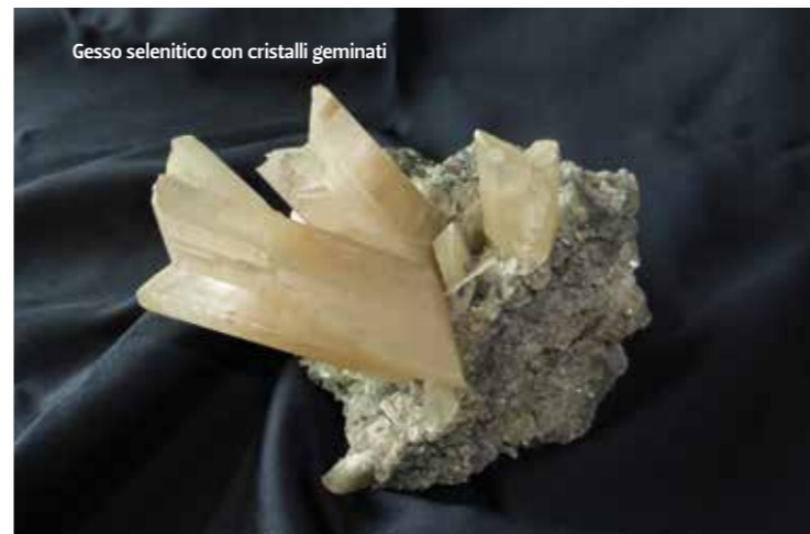
Gesso selenitico con cristalli geminati

Eccoci ai piedi del monumento simbolo della città di Bologna: le due torri. La torre degli Asinelli, la più alta (97,20 m), e la torre Garisenda più bassa (47 m) e molto pendente. La base della torre Garisenda è rivestita di selenite con caratteristici cristalli geminati "a coda di rondine" dalla lucentezza lattiginosa che richiama il riflesso della luna (selene in greco). La selenite è una roccia costituita da gesso che si è originata dall'evaporazione dell'acqua marina. Nel Messiniano (circa 6 milioni di anni fa) la chiusura dello stretto di Gibilterra determinò l'isolamento del Mediterraneo dall'oceano Atlantico. In queste condizioni, nei bassi fondali dei bacini marini che bordavano l'Appennino si depositò la selenite. L'ampia diffusione della selenite a Bologna è legata alla vicinanza delle aree estrattive dei gessi e alle sue proprietà di isolamento dall'umidità. Di selenite è la prima cerchia di mura della città (IV-VI secolo) e anche gran parte delle fondamenta degli edifici. La caratteristica pendenza delle torri si deve alla natura del sottosuolo. Il terreno al di sotto delle torri è composto da limi e argille a differente livello di consolidamento. Il carico statico delle torri ha determinato, nel tempo, un cedimento non omogeneo del terreno e delle fondamenta che negli ultimi cento anni è aumentato con un tasso di 0.3-0.4 mm/anno.