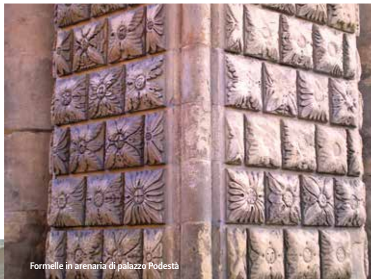
Formelle in arenaria di palazzo Podestà

L'argilla (creta), l'arenaria e la selenite sono pietre locali e per questo sono così diffuse negli edifici e nei monumenti del centro storico. L'arenaria è una sabbia cementata i cui granuli sono costituiti prevalentemente di quarzo. A Bologna è presente almeno in due differenti qualità: una giallastra, poco cementata e poco resistente (su cui sono evidenti le forme di degrado) e un'altra, nota anche come pietra serena, di maggiore durezza e di colore grigio azzurino. L'argilla, sotto forma di laterizio e cotto, è il materiale che domina nei palazzi e monumenti cittadini. Il colore varia dal rosso al giallo. A Bologna, scarseggiando le pietre, il cotto venne largamente usato sin dai tempi degli Etruschi, ciò gli ha valso il nome di Bologna la rossa. Nella facciata del Palazzo Comunale l'arenaria è la protagonista del portale, e l'argilla è il materiale con il quale Nicolò dall'Arca plasmò la bellissima Vergine col Bambino che oggi decora la facciata. La