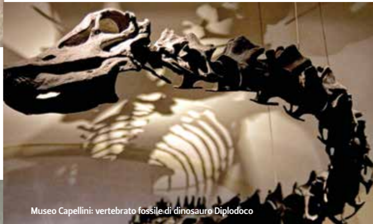
Museo Capellini: vertebrato fossile di dinosauro Diplodoco

Qui sorgono due importanti musei ottocenteschi, inaugurati nel momento di massimo splendore della geologia a Bologna. Il Museo Geologico "G. Capellini" fu istituito nel 1860 quando Giovanni Capellini venne chiamato dall'Università di Bologna per ricoprire la prima cattedra di Geologia in Italia. Nel museo sono esposti reperti provenienti dal territorio regionale e nazionale e ricche collezioni di rocce, piante, invertebrati e vertebrati fossili. Fra questi spicca lo scheletro di un Diplodoco di 26 metri di lunghezza e 4 di altezza donato da Vittorio Emanuele III e rinvenuto nel 1899 nel Wyoming. Il Museo di Mineralogia e Petrografia "Luigi Bombicci" fu istituito nel 1861 quando a Bombicci venne affidata la prima cattedra di Mineralogia dell'Università di Bologna. Il Museo espone circa diecimila pezzi, un quinto circa del patrimonio totale delle collezioni, suddivisi in sezioni. Tra queste vi segnaliamo la sezione dedicata alla pietra fosforica di Bologna. Con questo nome è conosciuta in tutto il mondo la particolare varietà di baritina che si rinviene nei calanchi di Paderno. Scoperta tra il 1602 e il 1604 rappresenta la prima osservazione del fenomeno della fosforescenza. Sistema Museale d'Ateneo Università di Bologna: www.sma.unibo.it