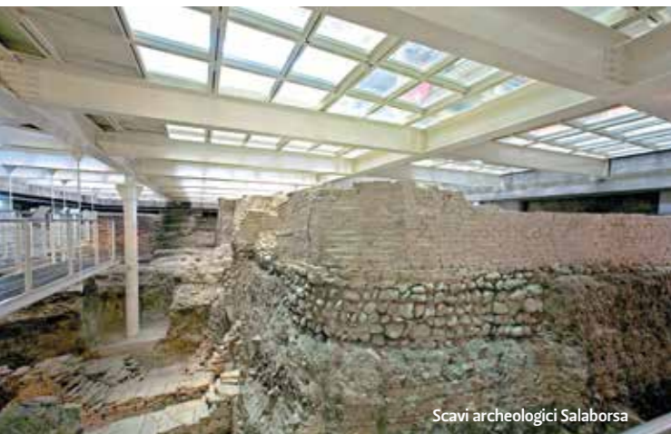
Scavi archeologici Salaborsa

Un pavimento di cristallo apre la vista sugli scavi archeologici che, nel 1989-90, hanno rivelato l'esistenza di un edificio probabilmente sede di uffici amministrativi della colonia romana Bononia (II-I sec. a. C.). Le indagini geologiche hanno rivelato che il sottosuolo di Bologna è caratterizzato dalla presenza di ghiaie, sabbie, limi e argille. Le argille e i limi sono presenti nel centro storico, mentre le ghiaie e le sabbie si concentrano alla periferia della città dove sono state depositate dal fiume Reno e dal torrente Savena. Questa distribuzione dei sedimenti nel sottosuolo indica come Reno e Savena si siano avvicinati più volte al centro storico senza mai attraversarlo. Ed è proprio in quest'area, maggiormente protetta dalle alluvioni, che venne fondata la colonia romana di Bononia.