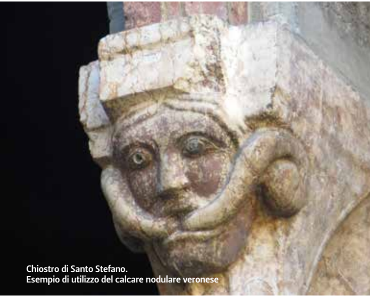
Chiostro di Santo Stefano. Esempio di utilizzo del calcare nodulare veronese

nodulare veronese. Il calcare d'Istria, cavato fin dai tempi dei romani, è piuttosto diffuso in città dove giungeva dalle cave della Croazia passando per Trieste, Venezia, Ravenna e quindi per via fluviale a Bologna.