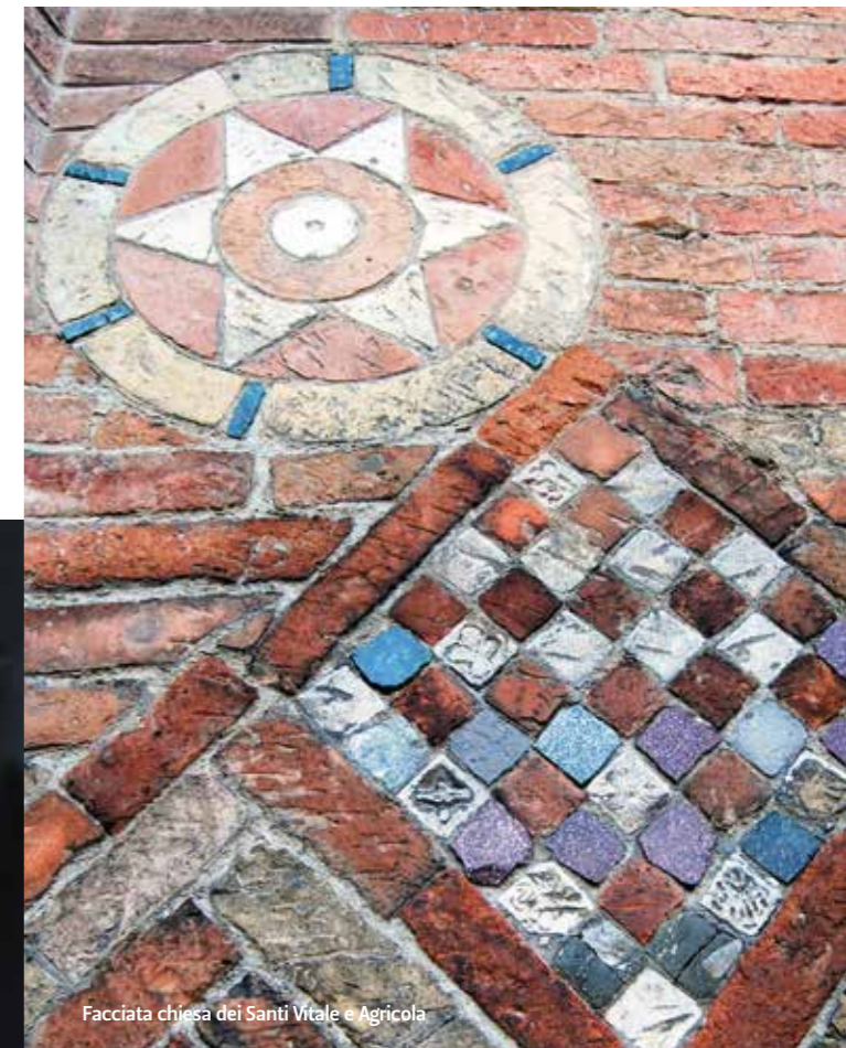
Facciata chiesa dei Santi Vitale e Agricola

tra gli altri oggetti d'interesse, due sarcofagi in marmo sorreggono una lastra di marmo greco proveniente da un monumento romano. Nella basilica del S. Sepolcro, sette colonne in marmo africano circondano il sepolcro di San Petronio. I marmi africani, come quelli apuani e greci, giunsero a Bologna solo in epoca imperiale romana. Poi il loro uso cessò del tutto per riprendere a partire dal 1850 con l'avvento del trasporto su rotaia.