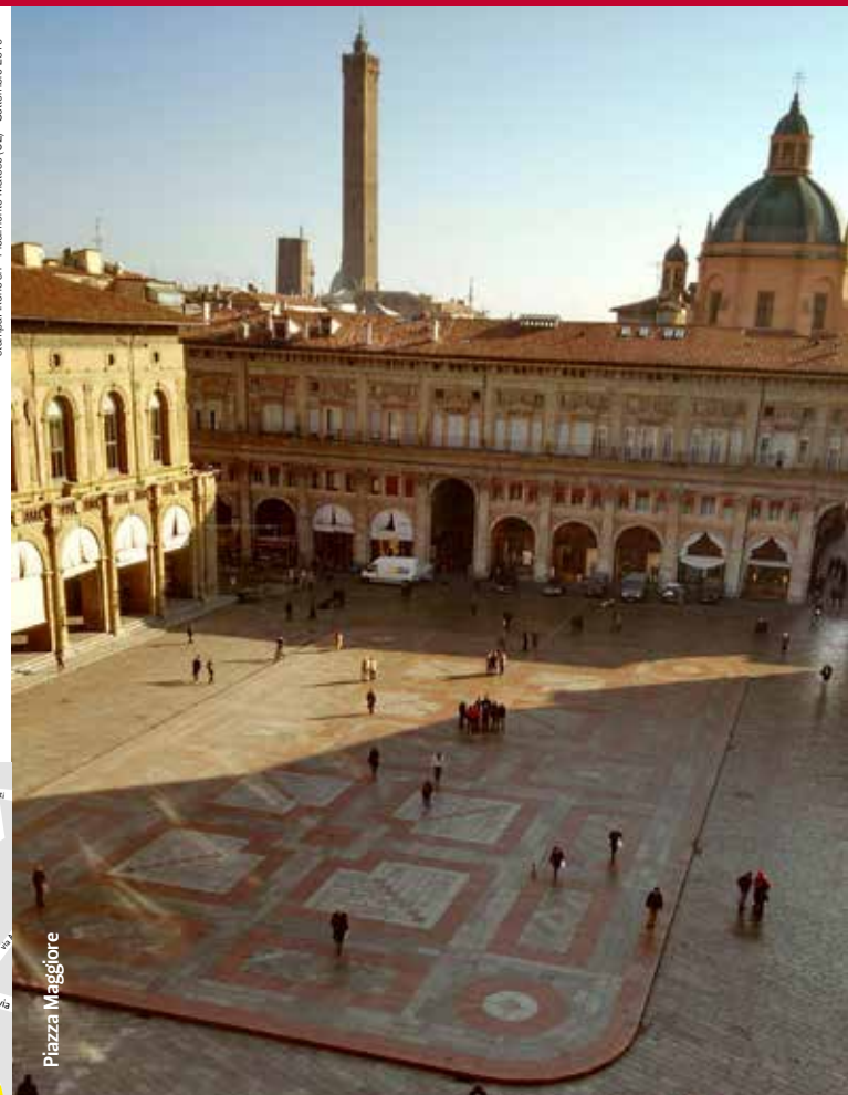
stampa: Irene srl - Piedimonte Matese (CE) - Settembre 2016