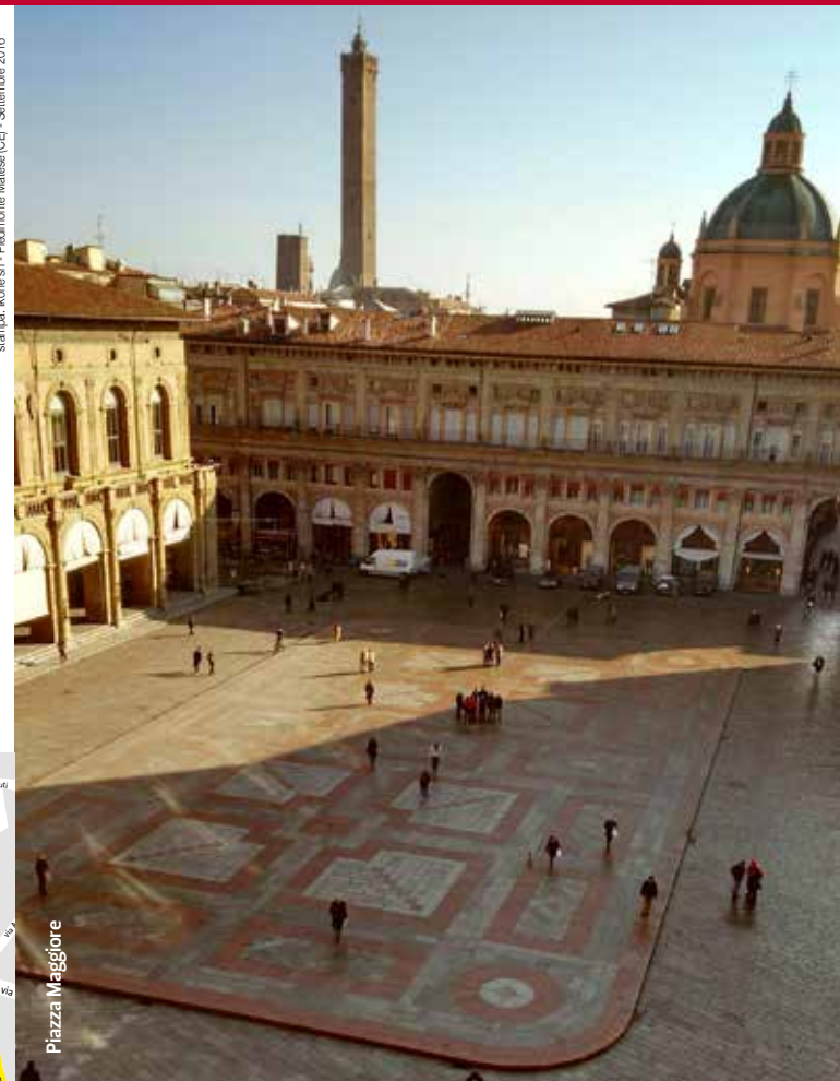
stampa: Irene srl - Piedimonte Matese (CE) - Settembre 2016