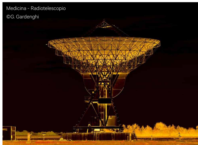
Medicina - Radiotelescopio

A Medicina (n. 10) nasce Pier da Medicina, che Dante mise all'Inferno