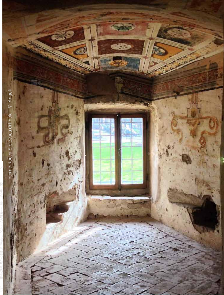
Interno Rocca Sforzesca di Imola - © Angeli