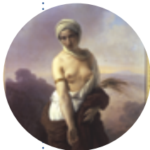
Francesco Hayez (Venezia, 1791 –Milano, 1882) olio su tela, 1835