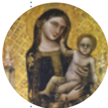
Vitale da Bologna (doc. dal 1330 al 1359) olio su tavola, 1345

Il dipinto è uno dei capolavori dell'artista, che interpreta il soggetto biblico accentuandone la bellezza sensuale, velata di malinconia. La gamma cromatica è basata sulle sottili variazioni delle tinte, dalla sabbia ai terra, facendo risaltare il corpo provocante della spigolatrice.