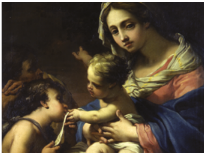
↗ Gaetano Gandolfi, "Sacra Famiglia con San Giovanni Battista bambino", 1787, olio su tela, 79,2x103cm

il XVIII e l'inizio del XIX secolo e in cui si può ammirare l'Apollino di Antonio Canova.