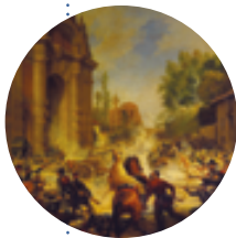
Antonio Muzzi olio su tela, 1849 ca.

Telaio bolognese per damaschi, modernizzato nel corso del XIX secolo con l'applicazione della tecnica Jacquard che, sfruttando un sistema a schede perforate, rivoluzionò i tempi della tessitura e l'organizzazione del lavoro di produzione tessile.